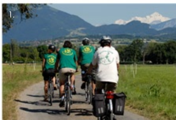
1. et 2. Alter Tour 2011, en Haute-Savoie

Nous devons "Vivre simplement pour que d'autres puissent simplement vivre" (Gandhi).