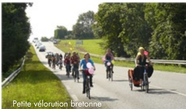
Petite vélorution bretonne

Des ateliers (décorations de vélos, réparations), la fête, manger, se baigner, parler et du VÉLO !