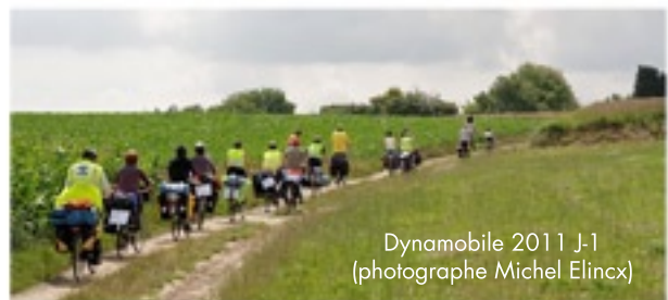
Dynamobile 2011 J-1

Cette année, la rando de l'association française CyclotransEurope (CTE) ira de Cologne à Pontoise, d'où Dynamobile partira. Les Dynamobiliens qui souhaiteraient rallier Pontoise à vélo, pourraient accompagner CTE. Dynamobile et CyclotransEurope partagent les mêmes valeurs associant promotion du vélo et plaisir des vacances à vélo. Elles organisent deux randonnées en une, quand l'une finit, l'autre commence.