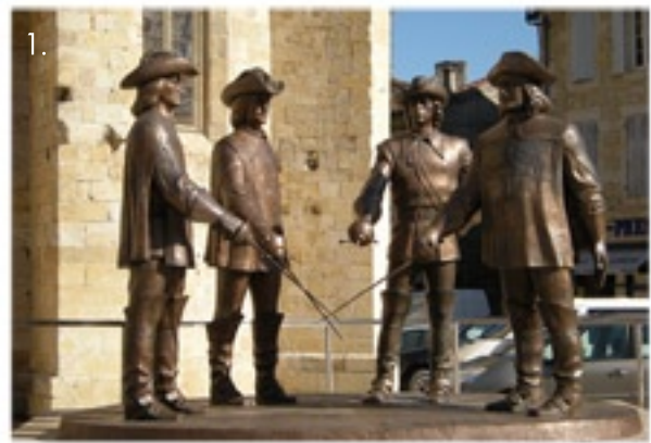
1. Condom, sur la vallée de la Baïse

Soutenu par l'AF3V, la FFCT et Cyclo-Camping International.