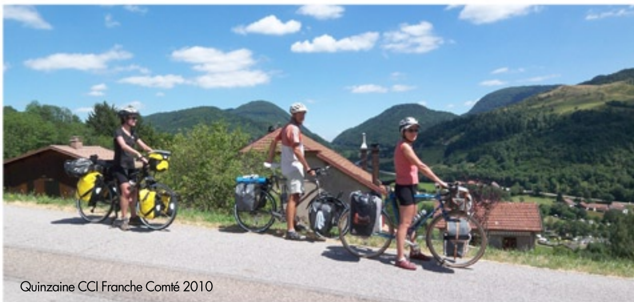
Quinzaine CCI Franche Comté 2010